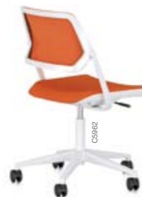
QiVi conférence, 5 branches sur roulettes, dossier résille « net »