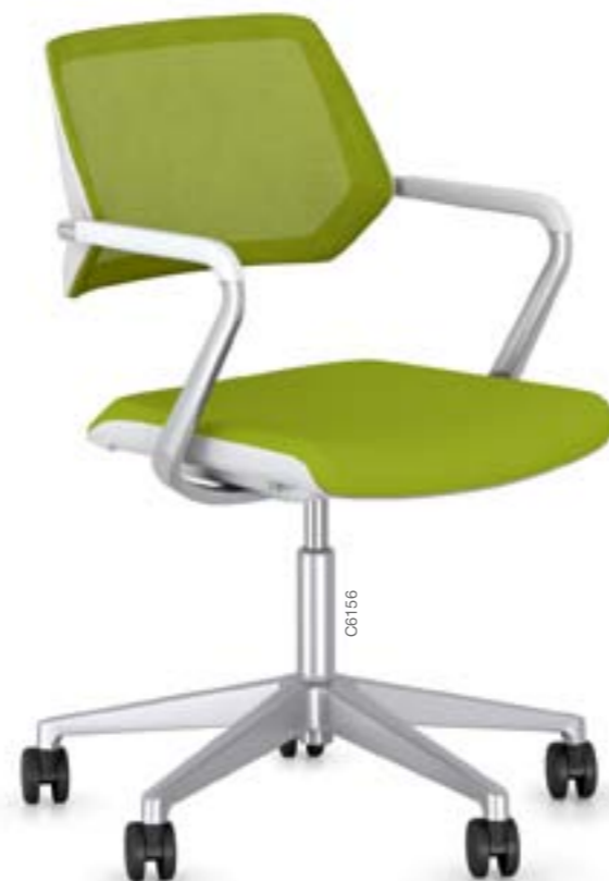
QiVi conférence 5 branches, sur roulettes, dossier résille « net »