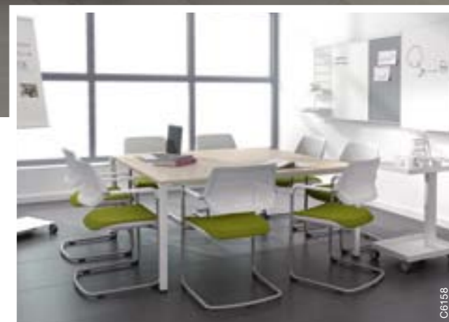
Qivi 4 pieds sur roulettes, dossier résille « net » et FlipTop Twin