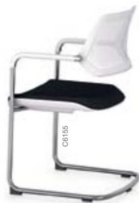
QiVi luge, dossier coque nue