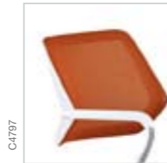
Dossier résille « net »