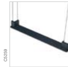
Espaceur de rangées