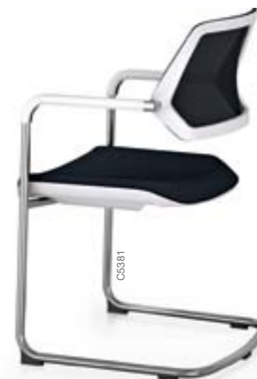
QiVi luge, dossier résille « net »