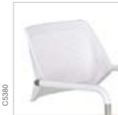
Dossier coque nue