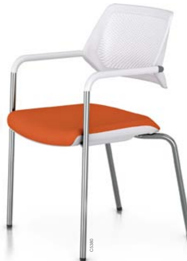
QiVi 4 pieds, dossier coque nue