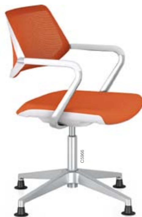
QiVi conférence 4 branches, sur patins, dossier résille « net »

Les deux styles de dossier présentent une constante : la structure du dossier est visible de face comme de dos. Grâce à sa largeur de gamme, QiVi offre confort et cohérence esthétique à tous vos espaces de collaboration.