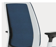
Tissu de revêtement du dossier