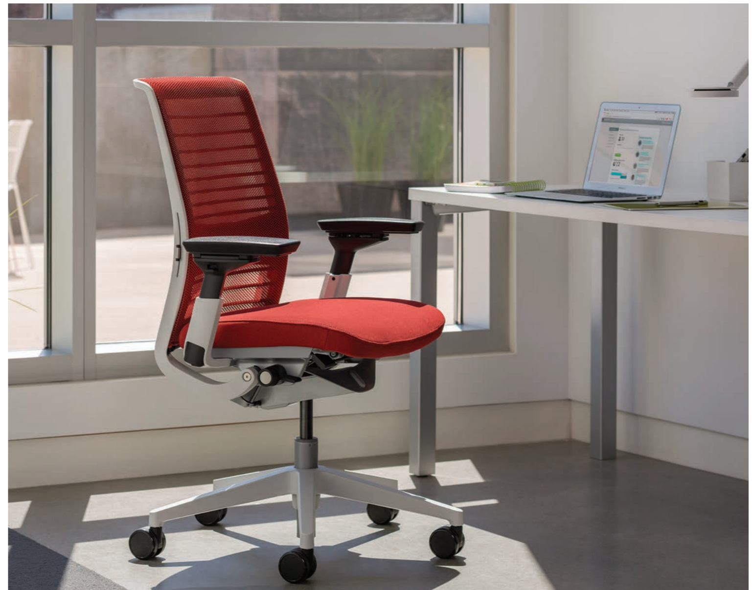
D0987 | THINK SIÈGE DE TRAVAIL (PM, 3D KNIT 14, AT15)

Le rebord du siège a été conçu pour s'adapter automatiquement aux mouvements de l'utilisateur et soulager la pression à l'arrière des genoux.