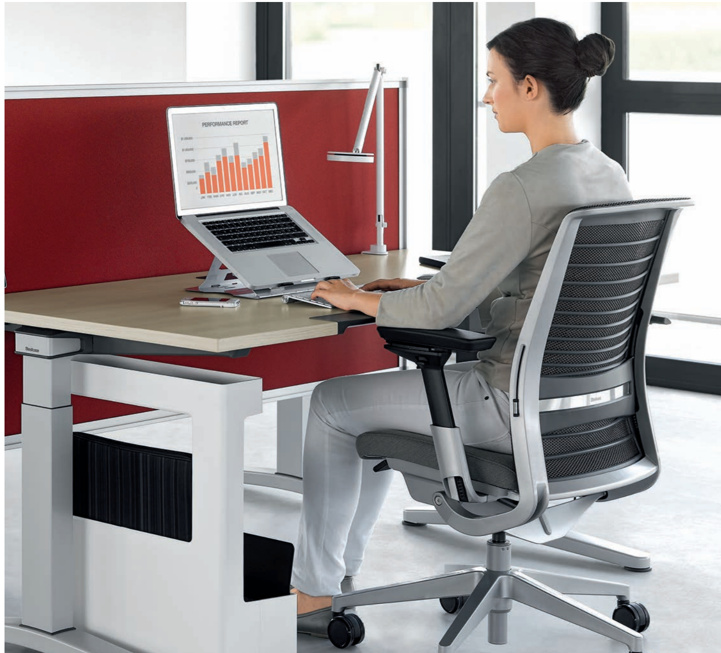
C9606 | THINK SIÈGE DE TRAVAIL (PM, 3D KNIT 01, AT04), BUREAU OLOGY (ZN, AT), ECRAN PARTITO (AT01)