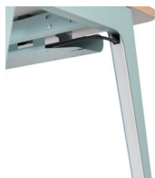
Cache-câbles (vertical) le long du piètement