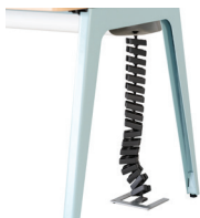
Montée de câbles plastique (verticale)