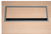
Trappe en mélamine