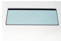
Trappe affleurante en métal