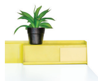
Organisateur de bureau