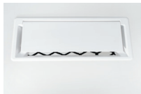
Trappe en plastique