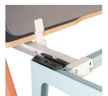
Kit de conversion bureau/bench