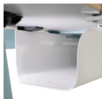
Goulotte horizontale (grande)