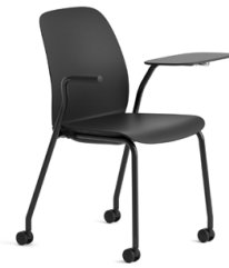
Chaises de classe