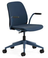
Chaises de conférence